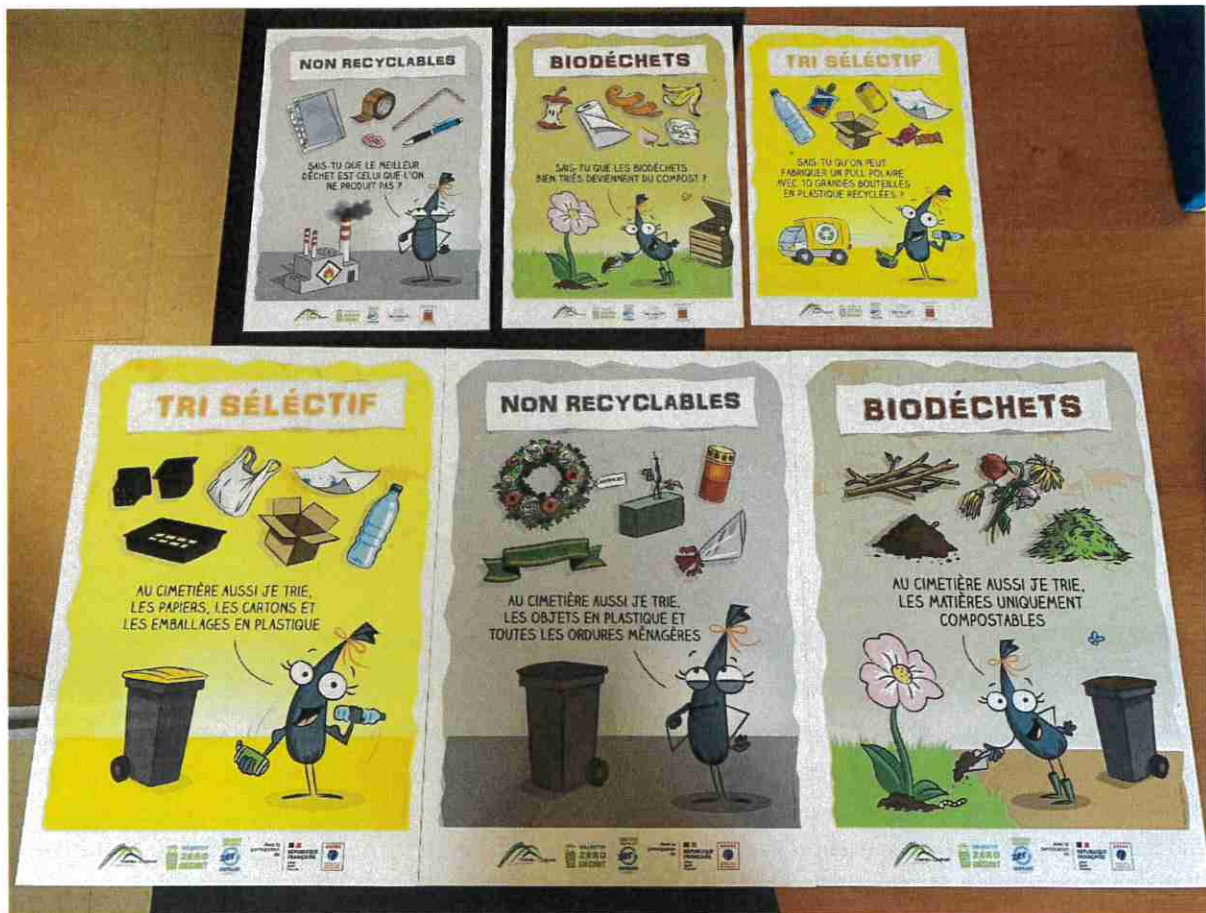
Photo des affiches créées par l'infographiste Hugo Mairelle pour promouvoir le tri dans les écoles et les cimetières.

Un bilan avant/après sera réalisé à la fin du projet.