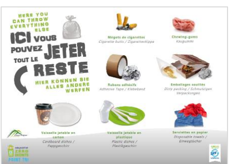
Affiches A4 : collées sur le couvercle des bacs, elles précisent – en 3 langues – les différentes consignes de tri